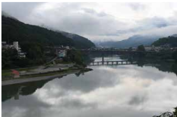
ラフティングを通じたチームビルディング研修

チームビルディングとは、『仲間が思いを一つにして、一つのゴールに向かって進んでゆける組織づくり』のことです。三好市では、ラフティングをチームビルディングに活用し、楽しむだけでなく、仲間と協力することの大切さやチームが成功へ進む過程を、短時間で体感できるものとして人気を集めています。